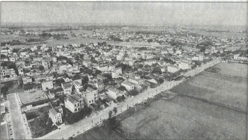
Một góc huyện Kim Bảng.

LÀ VÙNG PHÁT TRIỂN TRỌNG ĐIỂM DU LỊCH, DỊCH VỤ, CÔNG NGHIỆP CỦA TỈNH; NHÂN DÂN HUYỆN KIM BẢNG NÊU CAO TINH THẦN ĐOÀN KẾT, TRÁCH NHIỆM THỰC HIỆN CÁC NHIỆM VỤ TRỌNG TÂM, GIÀNH NHIỀU THẮNG LỢI TOÀN DIỆN LIÊN ĐƯỢC CHÍNH PHỦ TẶNG CỜ THI ĐUA XUẤT SẮC; ĐƯỢC TỈNH GHI NHẬN, HUYỆN, THÀNH PHỐ... ĐÂY LÀ TIỀN ĐỀ QUAN TRỌNG ĐỂ KIM BẢNG TIẾP TỤC DIỆN, PHẤN ĐẤU TRỞ THÀNH THỊ XÃ TRƯỚC NĂM 2025.