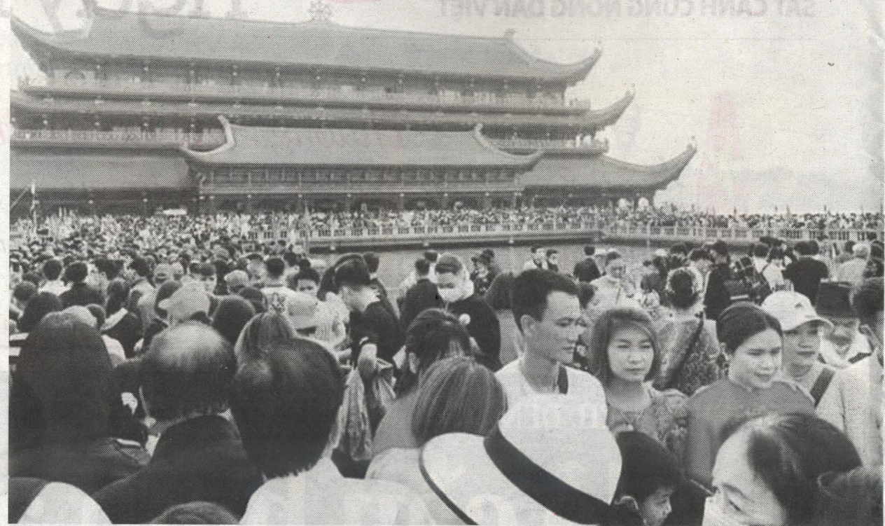
Biển người chen chân ở chùa Tam Chúc ngày 14/3. T.L

Chị Tú Quyên (phố Chùa Láng, Đống Đa, Hà Nội) cho hay: “Kinh hoàng là suy nghĩ của tôi khi chứng kiến biển người ở chùa Tam Chúc. Lo sợ mình ngột thở, và lo hơn cả là nguy cơ có thể mắc Covid-19 nếu nói đại chẳng may có ai đó mang mầm bệnh trong đám đông đó, nên tôi đã lập tức rời chùa mà chưa qua