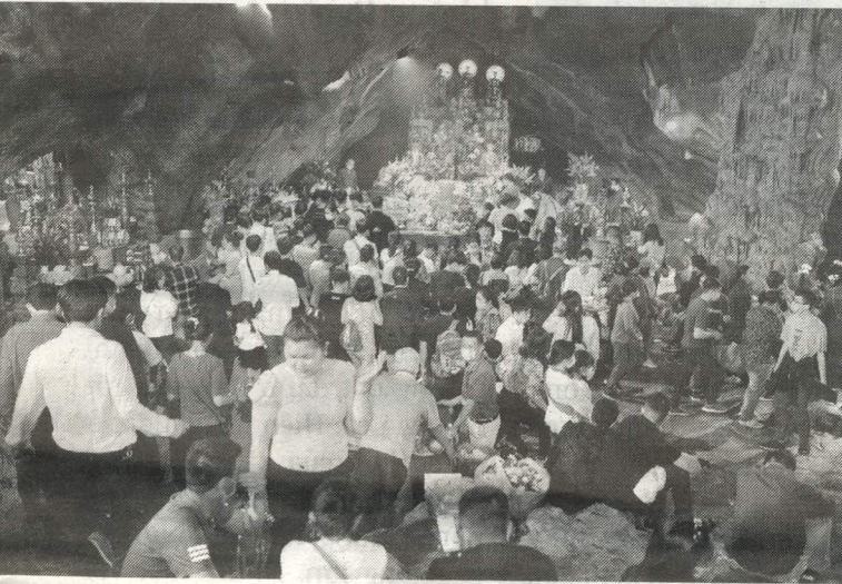
☉ Người dân lễ Phật trong động Hương Tích. G.K

Nhìn chung, tại các điểm du lịch, di tích, danh thắng trên địa bàn tỉnh Quảng Ninh đều đã thực hiện nghiêm biện pháp phòng, chống dịch theo quy định, xây dựng quy trình đưa, đón khách tham quan đảm bảo an toàn cho du khách.