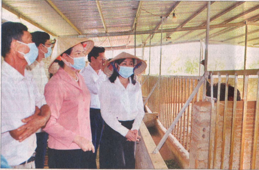
Các đại biểu HĐND tỉnh Hà Nam khảo sát mô hình phát triển kinh tế tại huyện Thanh Liêm.

Hà Nam xác định rõ các nghị quyết của Hội đồng nhân dân đóng vai trò rất quan trọng trong việc tổ chức thực hiện các chủ trương, đường lối của Đảng, Hiến pháp, pháp luật của Nhà nước và các nhiệm vụ phát triển kinh tế-xã hội, nâng cao đời sống vật chất, tinh thần của nhân dân. Thời gian qua, Hội đồng nhân dân các cấp tỉnh Hà Nam đã tích cực thực hiện các giải pháp nâng cao chất lượng xây dựng, ban hành và tổ chức thực hiện các nghị quyết của Hội đồng nhân dân.